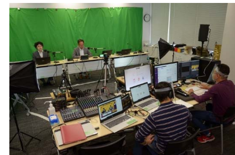
Live stream Studio in IW 2020